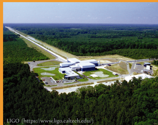
LIGO ( https://www.ligo.caltech.edu/ )