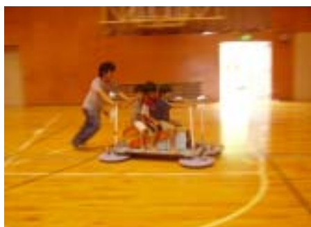
ホバークラフトに乗ってびゅーん！