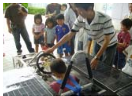
ソーラーカーの乗り心地は？